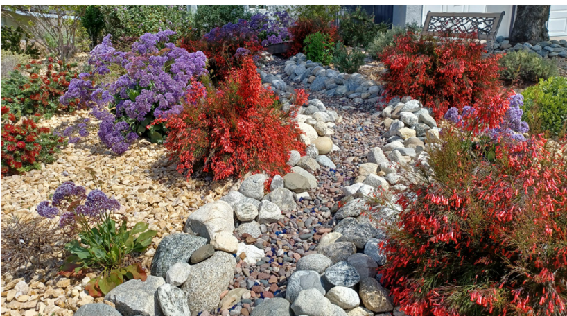
Un jardín resistente a las sequías.