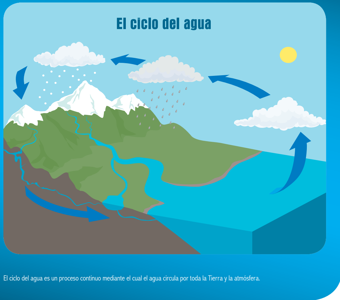
El ciclo del agua es un proceso continuo mediante el cual el agua circula por toda la Tierra y la atmósfera.