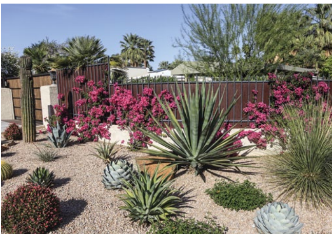
Un jardín resistente a las sequías.